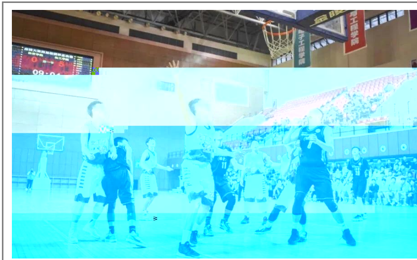
5月20日晚，作为我校传统体育赛事之一的“校园杯”篮球赛圆满落幕。经过激烈角逐，化工学院夺得本届篮球赛冠军，经管学院获亚军，城建学院和工创学院分获三、四名。(体教部供稿)

该项目旨在通过LED技术，提高怒州乡村的农业生产效率，助力乡村振兴。项目由我校LED技术植物组承担，团队成员包括ABC教授等。项目成果将应用于怒州乡村的农业生产，为当地农民带来实实在在的效益。