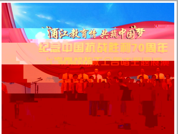
我校教工合唱团参加了上海市教育工会举办的上海高校纪念抗战胜利七十周年教工合唱交流展演

沟通 9 ~ 11 : %` 于非 理想化的状 $q 要 q 的 > 5 位的 5 求 无 知g 的工 ( h 业 ; $ 业的技 监> &以 毕业` & $ 入宿舍d %` g 12 ~ 寒假: %` hi q 有初 认 g 们 工 ( 整为 ; > %` 业bc 试$并 %` $ 以 的毕业` & p 们的 成功 试 g 寒假~h%: %` 于 心 整阶段$ q 业市 有 d $v %` P 实的苗 g 们 工 ( 在%` 的联 上$ p 们的 $并 ; g h%~5 : V 尚未 的%` 会有挫折感$ 会( 新定位 业 并P g 的工(下转第3版) ? @ABC