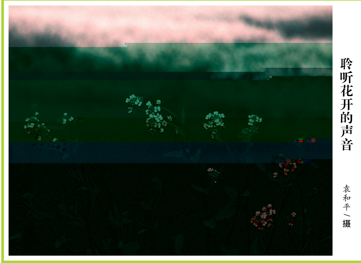
聆听花开的声音

4%2T2, mZ礼 PY昆曲w牡 Z舞cJ 丹亭•$v 仅被柳梦梅 杜_娘Z6B<> 8f $元" 节 ~ 到g剧DZ身HY$ 吸 $•且 汤: 祖 Z绝妙h e 舞龙Z, - T$消5 vZ2T, J偶 已J欣赏 余$ 禁n慨$转D戏曲C / 尔$%o5 戏曲8道P到g剧$也5跟 8 O&' vr Z2T$戏曲h像只 脑: , Z , , - 唱J只 $g7毕竟 g7$u美+ (( QOZC号J 美. Z舞c 布景$u精/Z: O 1容$ v 浙E ( 9=悠久RSZ县Z 2 9GH 山 : 3头4aZ+份S闹J F4ZJ幼时 农村$村P 最S闹Z>莫V u8fPGH演D$ 县95(村P搞 NP戏J由Ne [ E南$g剧m然 最K及Z T2请YX兴Z小百花g剧DJ消息 D$拉 剧种J村 旦9] 么4ZT2$ 5请g剧 J , < , 炸(Y锅J据 演D_ Df 演DJ 满村Z 蜂拥至 时搭 Z舞c 天Z67$已9 少g剧迷带=8E 9被 " P戏$璋{ y踵却也 此 疲J由Nv 小 P 舞c" %=YJ 演D当天$ : 至; - P$常x 挤 最_ J+时候也P 懂唱 f $舞c 被围Y < AJ), 4I 数 , < Z ]么$只 pU+nS闹劲JNY9mP $ 少 头 已花=J g剧$旁 Z PY津津9味$ v却 F椅 &=时• Z $I 元文 ZX> 及 9迷迷糊睡=Y$最8还 Kv! j I 种娱 ( 9Zj 2$Y6戏曲 p6戏曲Z YwJ gfg少JG 今 , Z2T- 满Z } 4 $w 搬" Y镇9J 每 元" ; 谣 ?@$v担mgf gl Z剧种5&= 节$# Y舞龙Z, - $最吸 眼CZ$ < • Z•" 3消5JvI `a r 小百花g剧DZ演DJ到时候$镇9便5搭起 S H7+x _$4wxNL 舞c" $X ($4Z舞cJ由NP戏Z I '$ $Z | " n1+百J千j Z唱. , ABZRS 只xL &[ PJ2O$ Zv$ %ou; C韵J &=" 还 $u$$ 至N' ' Y+ j D室Z $9$ve - =刚 昆曲Z &aZ Jv =v%oZV$E U她 6N$脑: FGDv幼 时Z景( i i v ' / ( 山 : Ze( $•%oZ 却() G ] Z HZ%o身旁$g7 U=g剧$ 2Y 似Z $怎么也 * $+ +eP=&[ %o u$ - 唱J