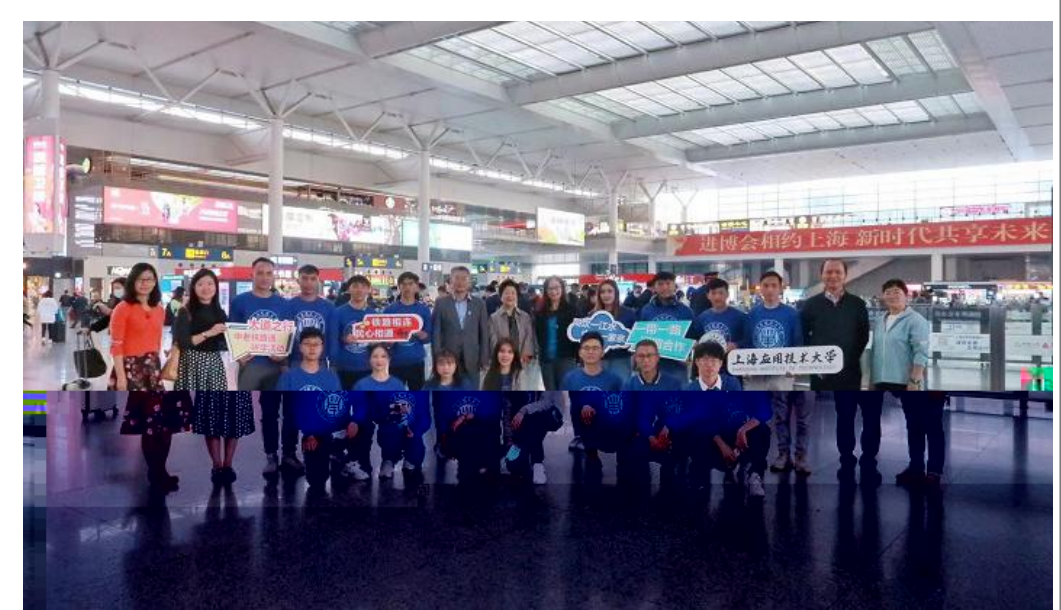
11月19日,我校2018级老挝留学生启程回国赴中老铁路现场开展实习。轨交学院同时开启“一带一路澜湄合作‘大道之行’”研学活动。图为老挝留学生与前去送行的领导、教师合影留念。

v月活=, ] Q大学y 2E p = B , 的 = 质。 W届j bj v月>E新^ 新j vG主题,活=b<' a, B 8, V?举OE 书 j vb^ 讲@658^ O 库上新E H J销E\B\ 的书 E j 书} k会OE - 论 G 作大 j b 、中z 书 、( (> SxyQ理上海 书 j b Pd* 活=, ` a校dz { , d s\ - 新特色j v, j vb , &xyj v | } ,更, i S学校教学、a研B学a建$ 精 j v。 (图书馆供稿)