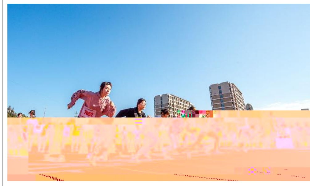
11 / 13 0123# 4 5 6# 78 5%9: ; < =>?@A5 ; < = BC DEFGH 3IJKL MNOP QRSTU VWXYZ Z[ \ ] ^ _ `abcd ef `ag hdj 3l ai @

术大学发挥轨道交通应用型人才培养的独特优势,与老挝开展高等教育合作项目,不仅为中老铁路培养了老挝本土技术管理人才和工程师,更是培养了中老两国的民间友好使。老挝上海苏、中国琅勃拉邦分,表示“中老铁路”建设项目使两国更亲,上海应用技术大学老挝培养的轨道交通本土化人才,为中老铁路交通力,用行中老友谊桥。校委在会中指,学校将不为止培养更本土化应用型高人才。“一带一路”合作教合体行学校还将不。以中老铁路联通过带,中老铁路“友谊之路、开之路、之路、之路”,人文交流民间合作。校长在主持中表示,上海应用技术大学分发挥铁路工教育的优势,!” # 4 $ %