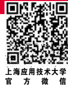
上海应用技术大学 官方微信

! " 5 31! 6 1! " A 87 ; Ga; O<23=5> n 8Hr "; O <(23*; ) " <(23 "; O<(23CDE" ; O <(23* <23 "; O<(23*(; ) "(; ) "(; ) 8a; ' RWO <23*(23" << W225 8 8 a 8 d ; * < R 8" a =5>7 kdA; • • e " F < A; d a • " G" "