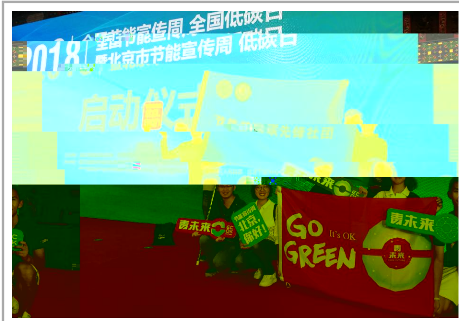
2018 年全国节能宣传周全国低碳日活动于6月11日启动,我校三位同学经市教委选派代表上海市“青未来联盟”参与活动。会后,我校学子接受了央视及相关媒体的采访。

!" u) 7b pJ" dP 意9a ; { zj " *89 : ; ) 7b 省*: 8省W安; 省+, z<' O ; { 8GH e { z <l 8 = z <l ,F• cd {• { > 8 ~! 7y?O 安K"VXPJ +* Az) a { z <l @A LZ ?M"遵N {O "CD z* A*AB { %G W" sd{ {M Az y?O Az" VW { +, pJ8X\ 网+Z A { 89C e*熟 Az**D { M P=+, 6Q* ++ Az*徐D Az [ 10 , +[#R/8 ; +[ O ; e; ^_ 8 #R 82018• ( ) <l a: ; (: ) a 8 *) 7b 8 " Ny?O Az O ; X, { = ; J P O<23E小FAGd { GH +, +AYi 6Q[ "sA z <l e#NaN8L, >l d { ; . e N#Ra O ; PQez ] AGd (规划与政策法规研究室 供稿)