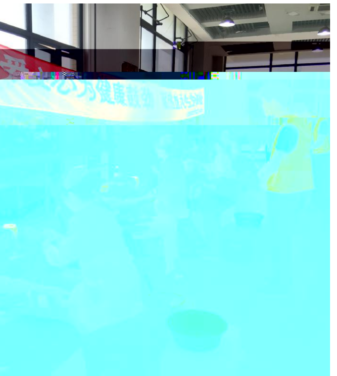
9月27日晚,我校4567名师生在逸仙校区逸仙楼报告厅参加了合唱比赛。762名师生参加了合唱比赛,现场气氛热烈,师生们纷纷表示,合唱比赛不仅锻炼了大家的团队协作能力,也丰富了校园文化生活。